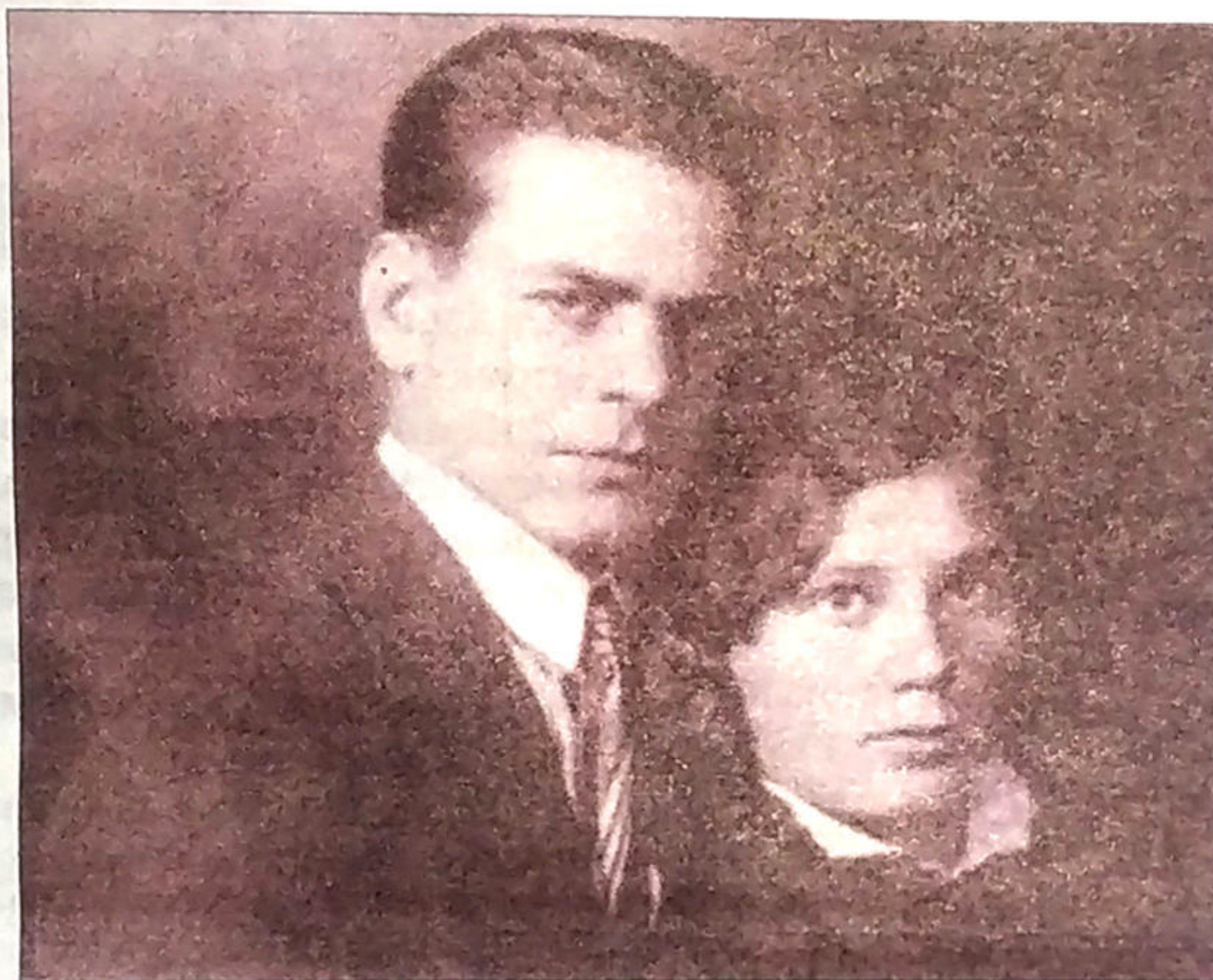
К. С. Заслонов с женой (Витебск, 1933 г.)

доказавшей свою компетентность и профессионализм – качества, в полной мере присущие Заслонову.