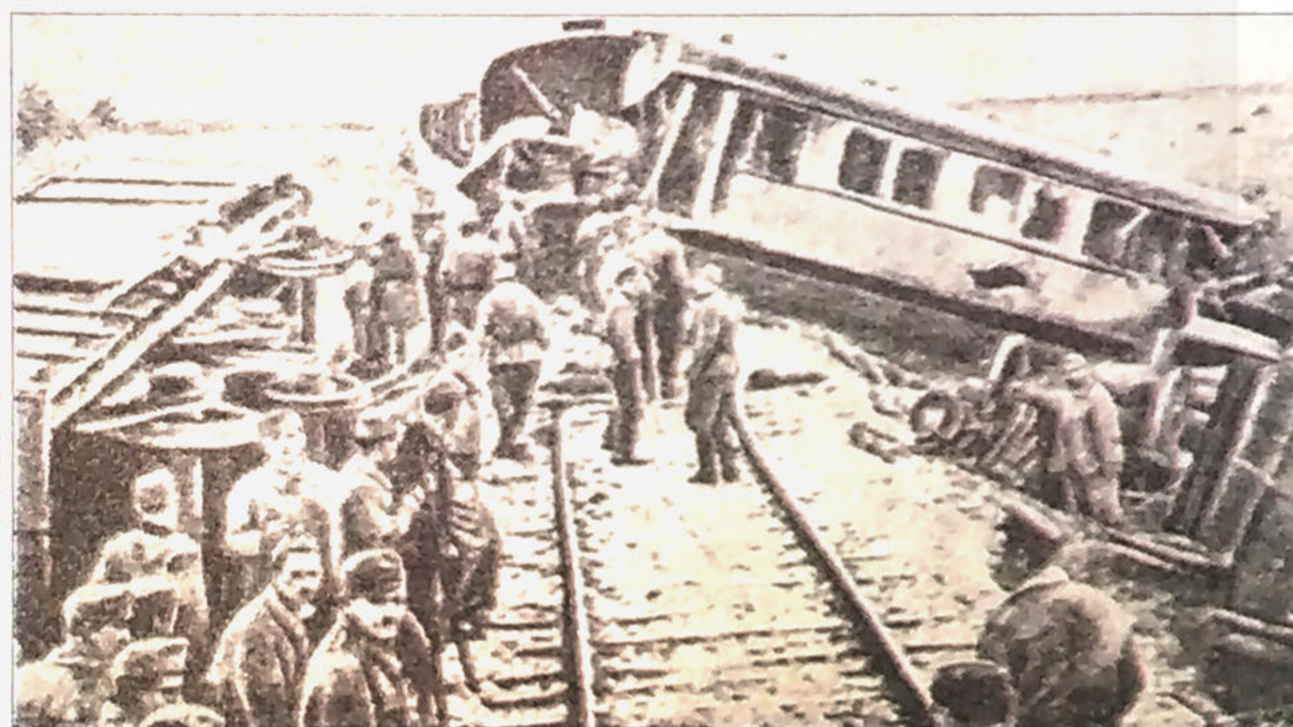
Диверсия на железной дороге, совершенная партизанами.