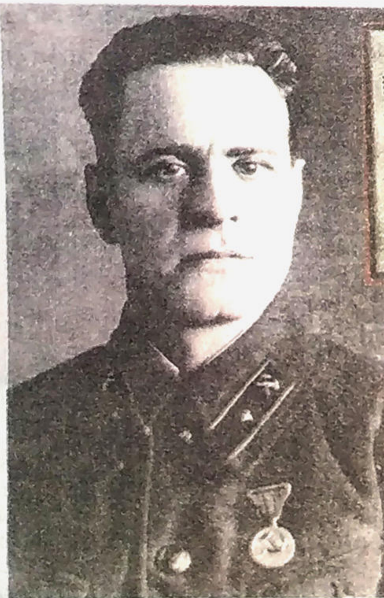
К. Заслонов перед началом войны (Орша, 1941 г.)

В конце 1941-го – начале 1942 года развернулись ожесточенные бои под Москвой. Враг приближался к столице, через Оршу постоянными потоками шли немецкие эшелоны с боеприпасами и живой силой. Подпольщики разными способами старались помочь Красной армии, в том числе изготавливали угольные мины, которые затем подбрасывались в тендеры паровозов. В пути следования снаряд, попадая в топку, взрывался, выводя локомотивы из строя и надолго задерживая движение составов.