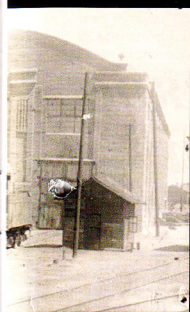
Дэпо ў Оршы, 1939 г.