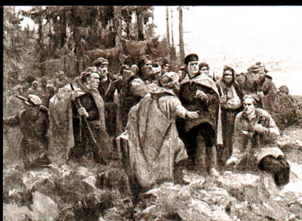
Карціна "Канстанцін Заслонаў": Мастак Яўген Зайцаў