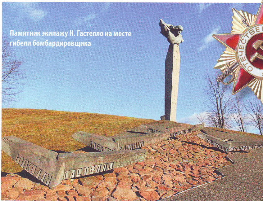
Памятник экипажу Н. Гастелло на месте гибели бомбардировщика

не мешало бы задаться и в наши дни, дабы историческая справедливость в отношении «забытых» была восстановлена в полной мере. Что, впрочем, не дает ни малейшего повода усомниться в величии подвига самого Гастелло. Ведь еще совсем недавно, в годы тотальной дегероизации (читай деградации) — в том числе под условным девизом: «Не надо было так упираться в войне, давно бы пиво баварское пили» — кто только не пытался нажить себе политический капитал на всевозможных исторических спекуляциях, на ревизии правды о Великой Отечественной.