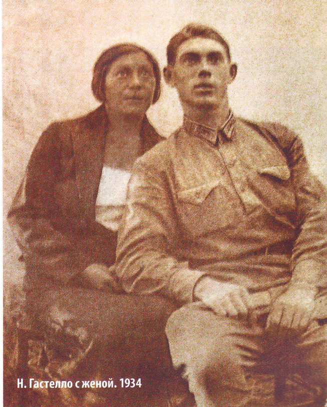
Н. Гастелло с женой. 1934

ы 12 дальнебойных орудий и свыше 500 ус (- пленных. * * * Ар 10 * * * я Х Героический подвиг совершил командир на И эскадрильи капитан Гастелло. Снаряд вра- Ъ жеской зенитки попал в бензиновый бак 0, его самолета. Бесстрашный командир на- 3- направил охваченный пламенем самолет на 1- скопление автомашин и бензиновых пи- У- стерн противника. Десятки германских 1а машин и цистерн взорвались вместе с са- т- молетом героя. * * * на * * * На одном из участков фронта на сто- рону советских войск перешел ефрейтор на ст