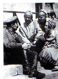
1930 г. МОСКВА. БУДЕННЫЙ БЕСЕДУЕТ С ДЕЛЕГАТАМИ XVI СЪЕЗДА ВКП(б)