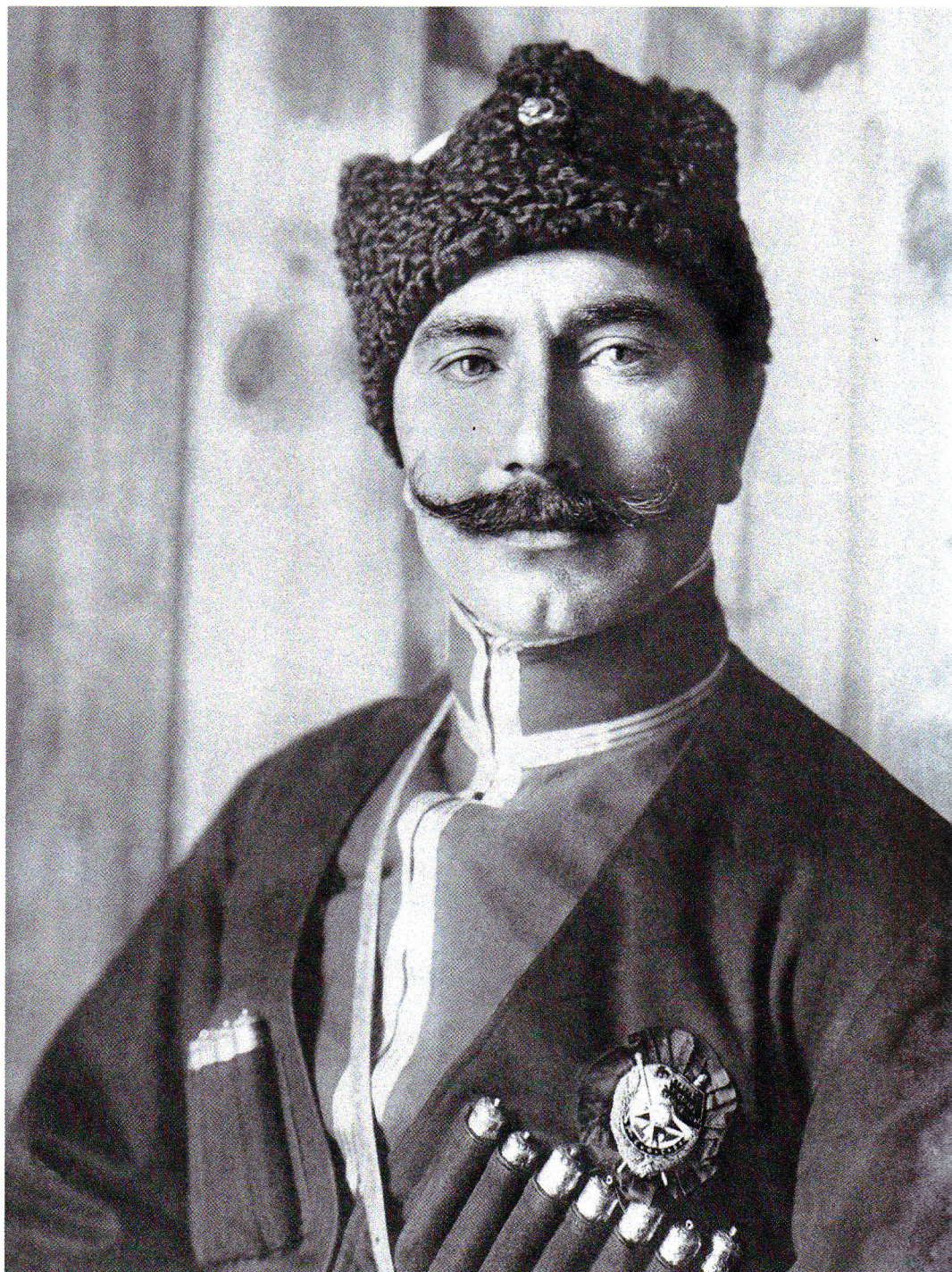
КОМАНДАРМ БУДЕННЫЙ НА ЮЖНОМ ФРОНТЕ

В 1928 году в стране назрел очередной продовольственный кризис, и для его преодоления Буденного вместе с Микояном направили на