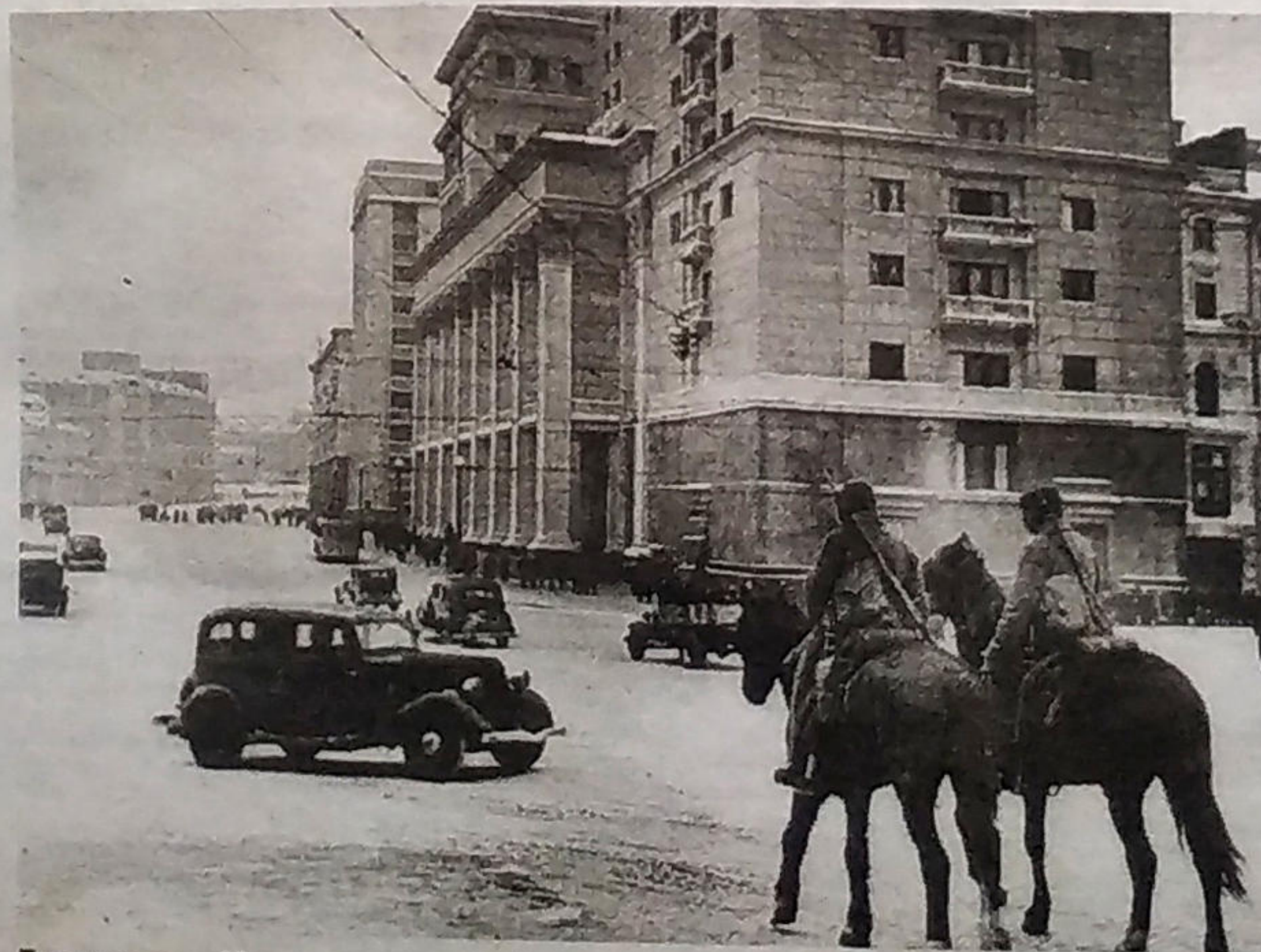
Гостиница «Москва» и конный патруль на Манежной площади в годы войны

«Секретарь Минского обкома партизанского движения в тылу противника, находился на оккупированной Минщине.