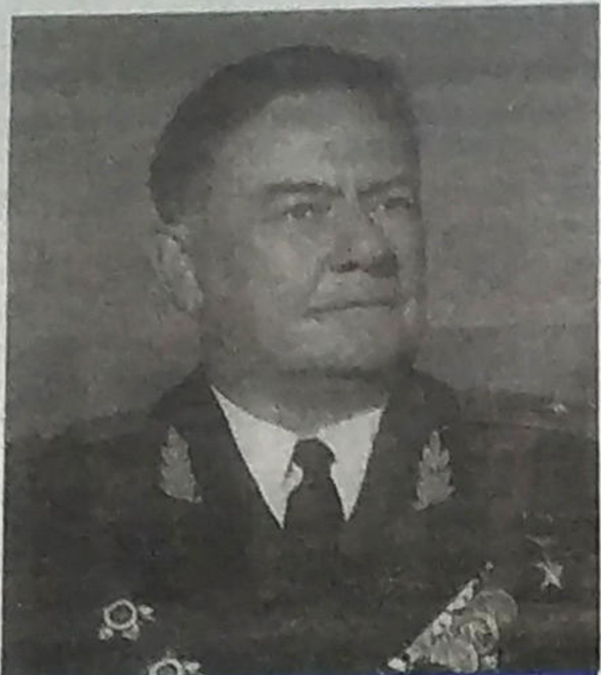
Герой Советского Союза В. И. Козлов